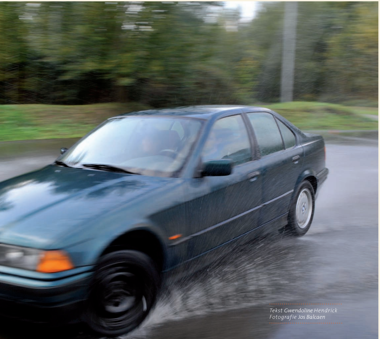
Tekst Gwendoline Hendrick