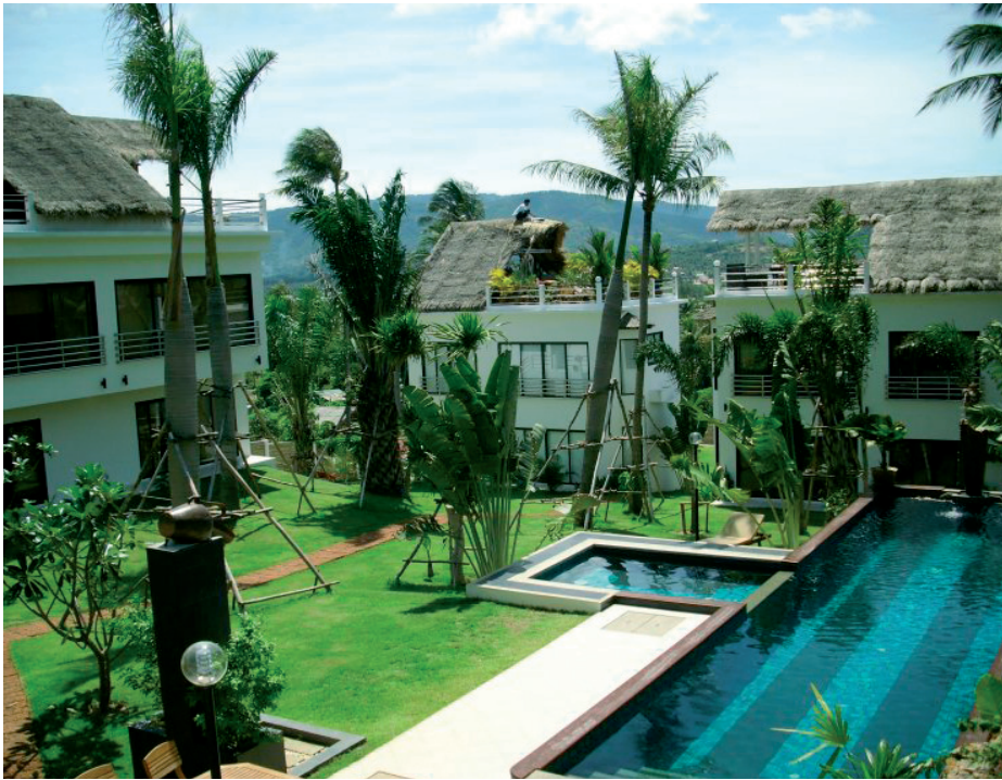
De financiële rechercheurs van het Plukteam stooten in hun zoektocht naar crimineel vermogen niet alleen op bankrekeningen en luxewagens, maar ook op vakantieparken op exotische bestemmingen.

10 euro. Men gaat over tot een huiszoe-king bij de dealer en daar treft men een pak hasjes van 500 gram aan in een specifieke gele verpakking, een precisie-weegschaal, lege zakjes én drie lege gele verpakkingen, identiek aan die waarin de 500 gram steken. Logischerwijze leidt men daaruit af dat de dealer al 1,5 kg aan de man heeft gebracht, goed voor een opbrengst van 15000 euro. Helaas is er geen geld te bespeuren – de dealer ontkent uiteraard in alle toonaarden dat hij 1,5 kg verkocht heeft – maar voor zijn deur blinkt een VW Golf die op zijn naam staat ingeschreven... Met akkoord van de magistraat mag de politie overgaan tot inbeslagname per equivalent van dat Golfke, in afwachting van de verbeurdverklaring. Dàt werkt ontradend!”