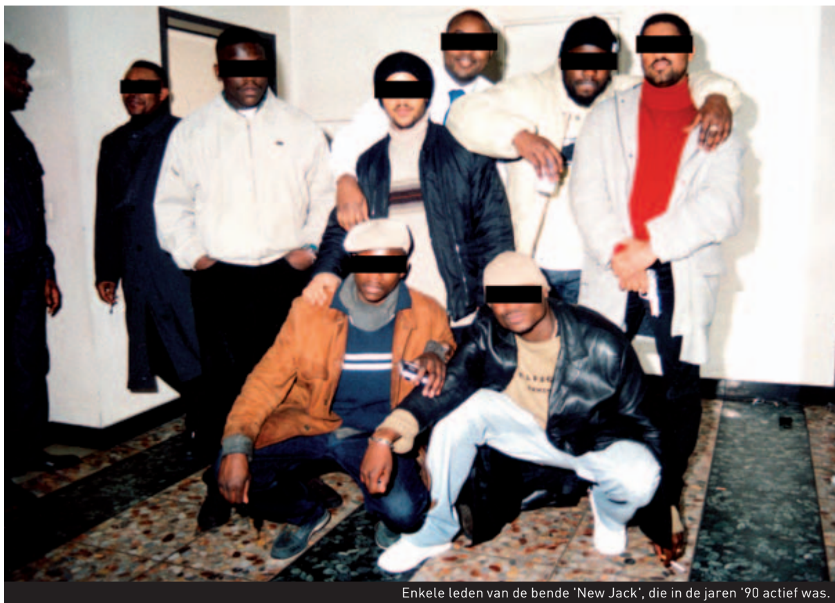
Enkele leden van de bende 'New Jack', die in de jaren '90 actief was.

steeds een 'hiërarchie'. Elke bende heeft een of meerdere leiders met daarrond de andere leden. Het zijn vooral die personen, vaak sterke persoonlijkheden, waarop de politie tracht te focussen, hoewel het niet altijd gemakkelijk is om die te identificeren. "De aanhouding van een of meerdere leiders tast de hele bende aan. Zodra onze diensten een actieve kern aanhouden, merken we dat de misdaad-