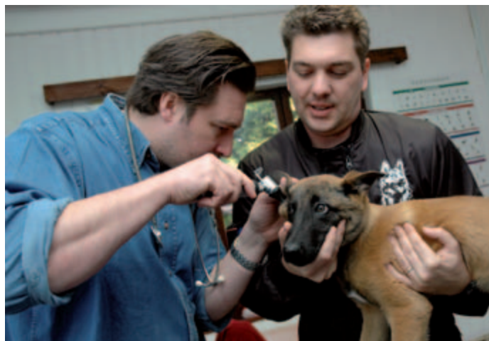
Tous les vendredis matins, le Service vétérinaire se rend à l'appui canin pour prodiguer des petits soins ou faire des vaccins.

s'habituer à d'autres environnements. Selon la spécialisation ultérieure du chien, le formateur choisit des endroits appropriés. Un chien restes humains aura ainsi besoin de s'entraîner en forêt. Juste avant l'examen final, un team canin – à savoir un chien et un maître pour éviter tout malentendu – accompagne 'en doubleur' les teams canins existants, une sorte de période de stage à proprement parler. Au sein de la commission d'examen siègent toujours un formateur et un officier de la police locale."