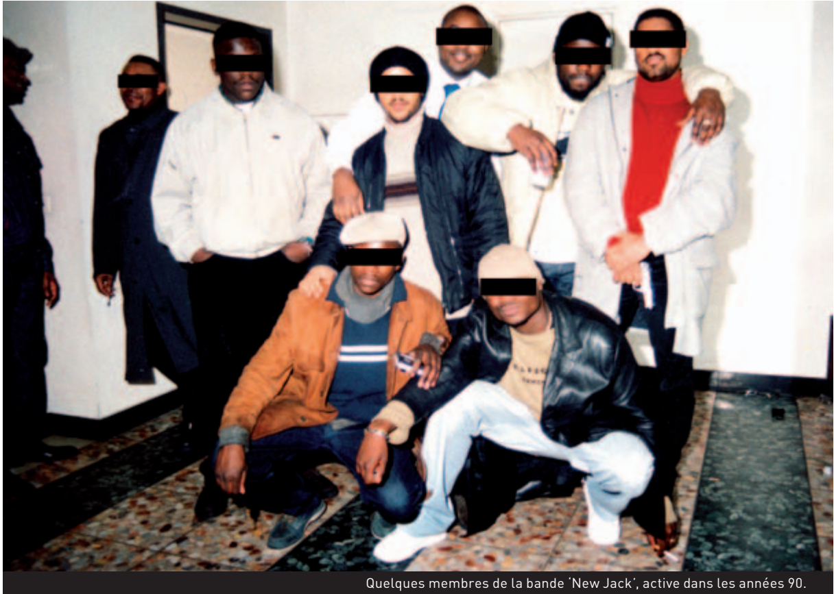
Quelques membres de la bande 'New Jack', active dans les années 90.

Si les bandes peuvent être 'structurées' de façon sensiblement différente les unes des autres, elles comportent toujours une 'hiérarchie'. Chaque bande compte son ou ses leader(s) autour duquel (desquels) gravitent les autres membres. Ce sont avant tout ces personnes, souvent de fortes personnalités que la police tente de cibler, même si leur identification n'est