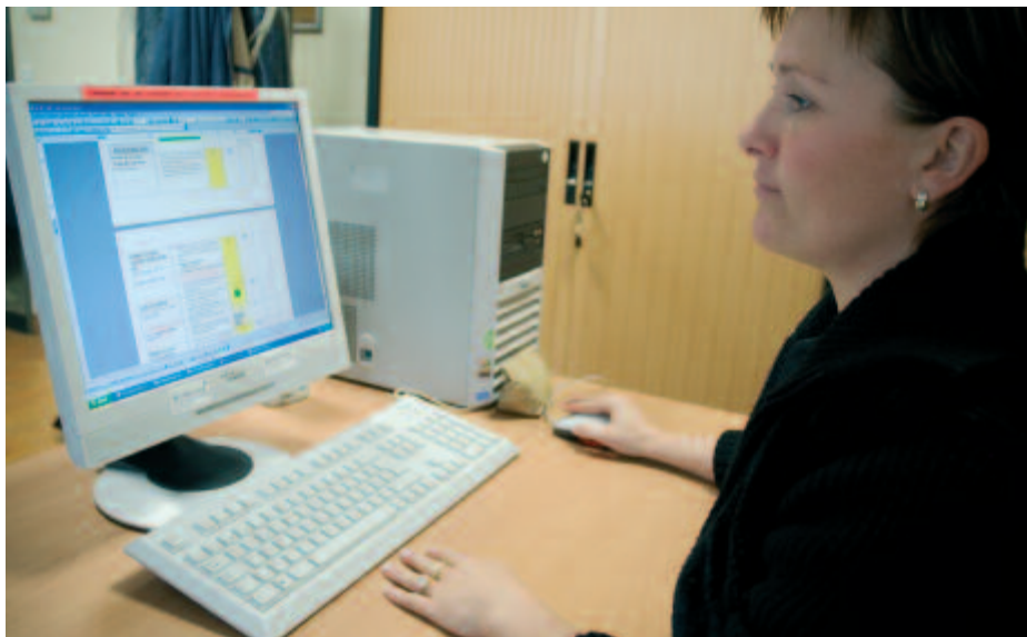
De programmeurs houden nooit op met het inbrengen van gegevens. Momenteel worden de 'major events' geanalyseerd.

manier kunnen we bijvoorbeeld onze collega's informeren of de bewoner van het huis waar ze naar toe moeten, al dan niet gewapend is. Dat is een belangrijk gegeven voor alle interventieploegen. Portal is een kostbaar instrument bij ons dagelijks werk."