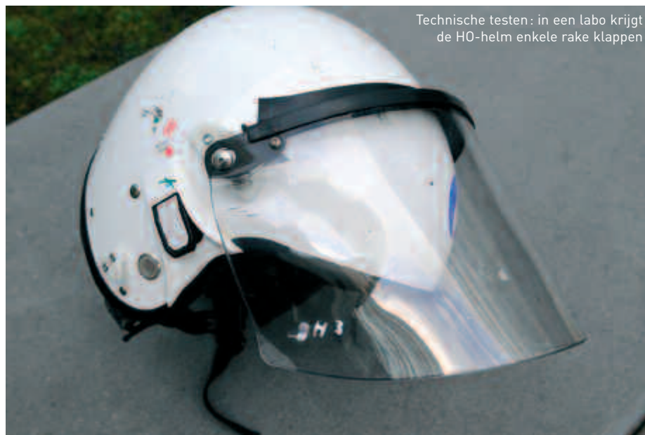
Technische testen: in een labo krijgt de HO-helm enkele rake klappen

En indien de normen niet zouden bestaan? De politie zou niet ophouden te functioneren, maar de geïntegreerde operaties zouden evenwel in gevaar kunnen komen door de verscheidenheid van het gebruikte materiaal. Op dit punt benadrukt Jean-Luc Parmentier: “Er zijn zoveel verschillende materialen op het terrein dat de afwezigheid van normen deze verschillen, die een typisch fenomeen zijn in het kader van de visuele identiteit, alleen maar zou benadrukken. Dat zou het succes van een geïntegreerde opdracht in gevaar kunnen brengen doordat problemen in gebruik ontstaan, vooral wanneer materiaal wordt uitgewisseld en samengevoegd waarvoor het gebruik een voorafgaande opleiding vereist.” Carine Vandeveldt besluit: “De normen vormen ook een garantie voor de lokale politie, die doorgaans niet altijd de middelen heeft om de uitrustingen te testen. Doordat de normen tijdens de openbare aanbesteding worden gerespecteerd, kunnen de politiezones die gebruikmaken van de federale overheidsopdrachten, op veilig materiaal rekenen.” ■