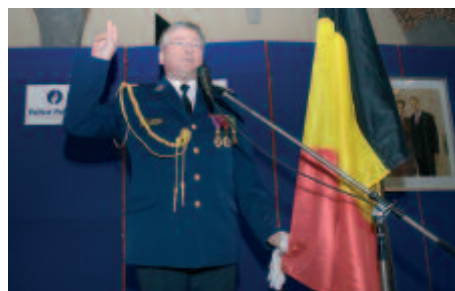
Foto hierboven: 27 februari 2007, de nieuwe commissaris-generaal legt de eed af.